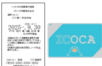
<バスICOCA定期券内容控>