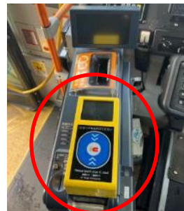
<降車時のICカードリーダー>