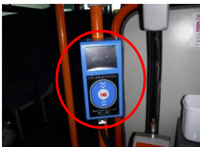
<乗車時のICカードリーダー>